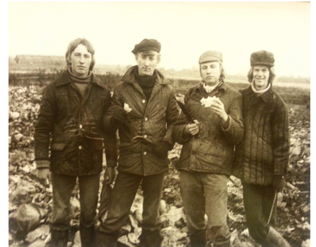
Отработка в колхозе, на капусте

получили большой жизненный опыт, многому научились, к тому же неплохо заработали, что было для нас немаловажно.