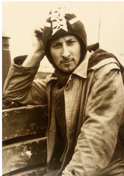
Студенческий строительный отряд

Конечно, было! Дело в том, что в медицинских учреждениях особо чтутся традиции, и всегда проходит посвящение в студенты. Я помню, что нас поздравил директор, было выступление старшекурсников. Больше всего, конечно же, запомнился момент, когда