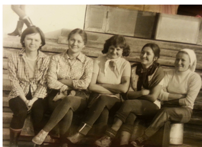
Отработка в колхозе

предложил нам пообщаться с этими ребятами. И мы вместе с участковым, ходили в гости к этим подросткам, интересовались, чем они занимаются, и как проводят свое свободное время, спрашивали, не требуется ли им какая-то помощь, общались с их родителями.