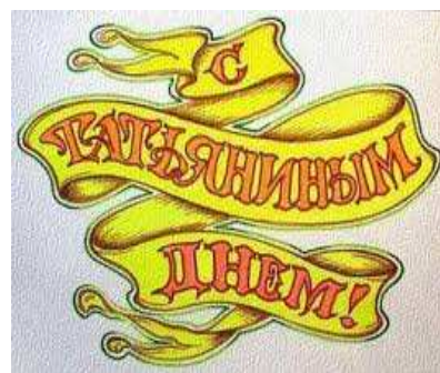
Пундарева И. 120 м/с

В канун этого прекрасного праздника студентов, я хочу пожелать вам, проживать каждый день ярко, насыщенно, познавать каждый день что-то новое, помнить о том, что студенческие годы - это лучшее время в нашей жизни. Потому что это молодость, это познание, это соприкосновение с наукой, это приобщение к будущей специальности, это дружба, любовь, и это все самое лучшее, что жизнь дает молодому человеку. Я вас поздравляю с этим праздником и желаю вам получать удовольствие от того, чем вы занимаетесь, чему вы хотите посвятить свои будущие жизни, а также желаю любви и удачи!